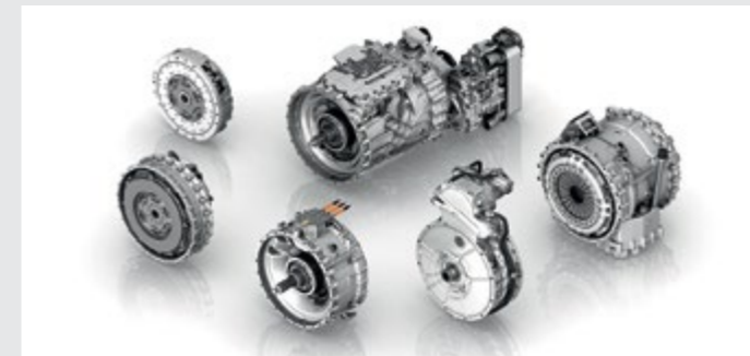
Flexibel: Das automatische Getriebe-System TraXon von ZF.

Das modulare Baukastenkonzept sorgt für grösstmögliche Flexibilität. Das Grundgetriebe lässt sich nicht nur mit einer Trockenkupplung, sondern auch mit weiteren Anfahrerelementen kombinieren: beispielsweise mit einem Doppelkupplungsmodul oder einem 120 Kilowatt starken Hybridmodul. Beide Technologien werden damit erstmals im Segment der schweren Nutzfahrzeuge verfügbar. Eigens für das neue Getriebe entwickelte ZF die Schaltstrategie PreVision GPS. Indem sie GPS-Daten und digitales Kartenmaterial nutzt, agiert die Getriebesteuerung vorausschauend und besonders kraftstoffsparend. <