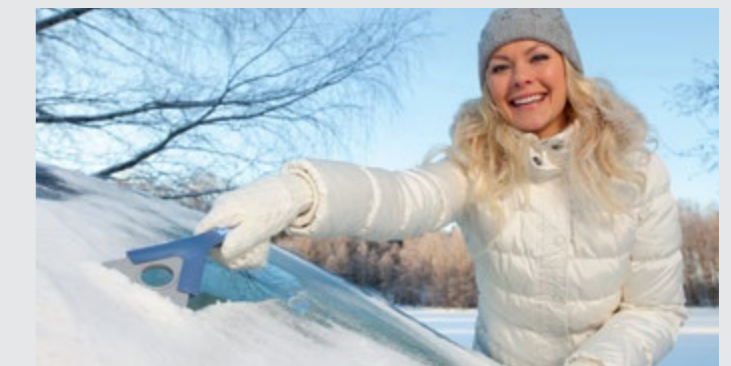
Im finnischen Winter getestet: Die drehbare KUNGS Polycarbonat-Schaber Klinge verfügt über scharfe Eiszacken.

pd. Die Eiskratzer, Schneeschieber und -besen des finnischen Marktführers KUNGS sind seit diesem Winter auch in der Schweiz erhältlich. In Kokemäki, Finnland, entwickelt und hergestellt, sind sie im Land der extremsten Winter Europas seit über zehn Jahren in den Fuss- und Kofferräumen der meisten Fahrzeuge zu finden.