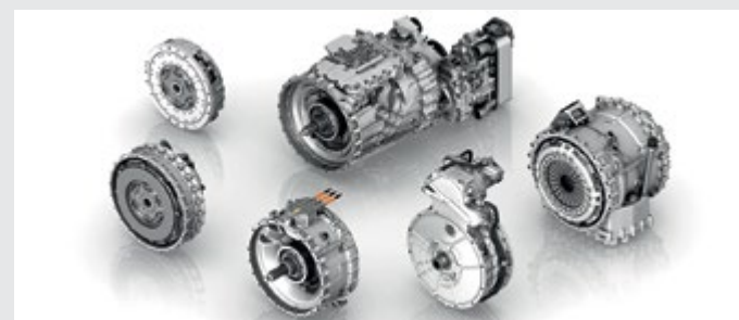
La boîte ZF TraXon assure une excellente flexibilité.

nouvelle référence en matière d'étalement du couple et de poids. Sa conception de boîtier modulaire assure une excellente flexibilité. La boîte peut être associée à un embrayage à sec, mais aussi à d'autres éléments, par exemple un module double embrayage ou un module hybride de 120 kW. Il s'agit de la première application de ces deux technologies au segment des poids lourds. ZF a développé la stratégie de changement de rapport PreVision GPS tout spécialement pour cette nouvelle boîte: cette commande exploite des données GPS et des cartes numériques pour anticiper et surtout économiser du carburant. <