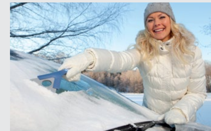
Testé dans l'hiver finlandais: le raclor pivotant en polycarbonate KUNGS dispose de lames affûtées.

pd. Les raclors à givre ainsi que les poussoirs et balayettes à neige de KUNGS, leader finlandais en la matière, sont désormais disponibles en Suisse. Développés et fabriqués à Kokemäki, en Finlande, ces accessoires font partie, depuis plus de dix ans, du matériel de base de la plupart des véhicules dans ce pays aux hivers rigoureux.